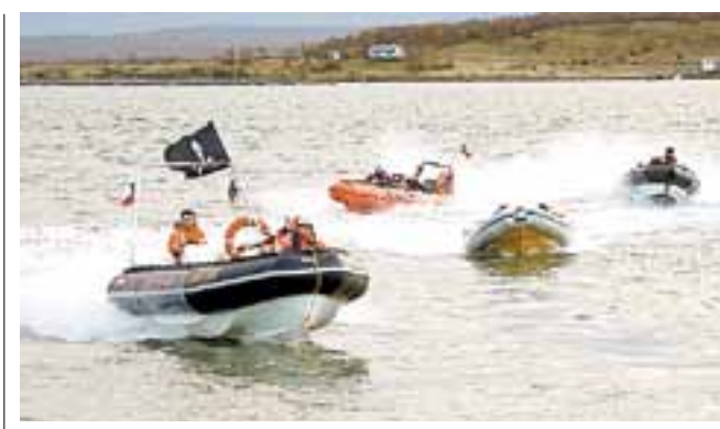
Club Deportes Náuticos