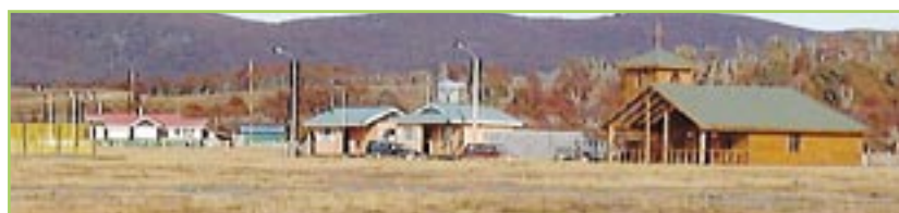
Vista general del sector de Pampa Guanaco. Al fondo se observa el retén fronterizo de Carabineros.