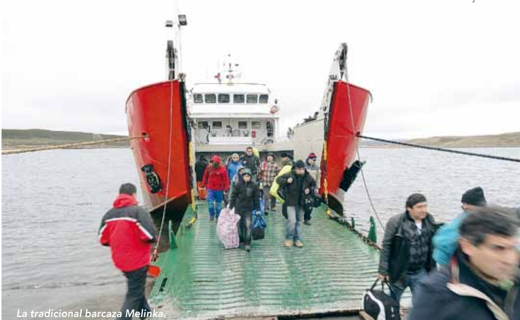
La tradicional barcaza Melinka.