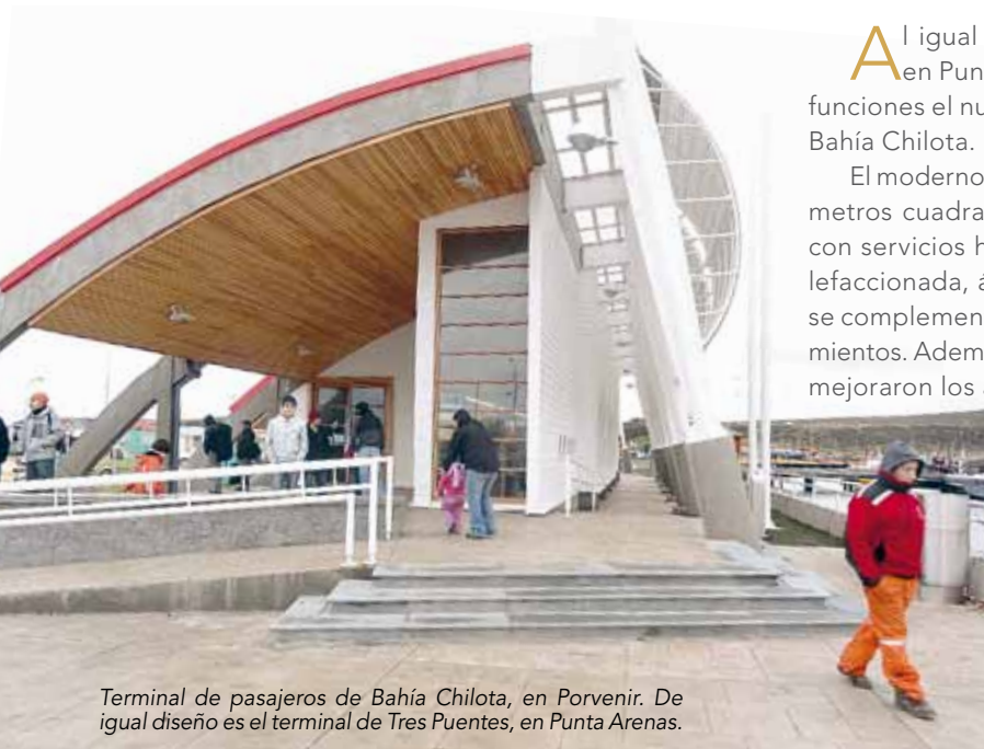
Terminal de pasajeros de Bahía Chilota, en Porvenir. De igual diseño es el terminal de Tres Puentes, en Punta Arenas.

Al igual que su par de Tres Puentes, en Punta Arenas, ya se encuentra en funciones el nuevo terminal de pasajeros de Bahía Chilota.