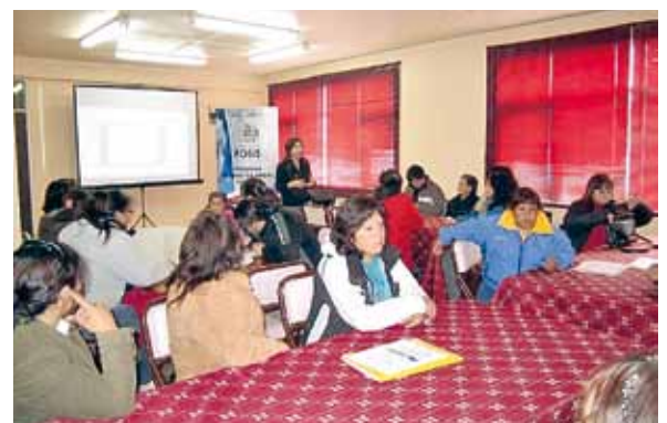
El año pasado, los beneficiarios participaron de un taller organizado por Fosis para fortalecer el desarrollo de sus proyectos.

"El desarrollo de nuestros programas en Porvenir va a significar un positivo impacto para las familias de mayor vulnerabilidad. Estamos enfocados en la promoción social de nuestros usuarios y usuarias para superar la extrema pobreza al año 2014", señaló Gonzalo Rosenfeld, director regional del Fosis.