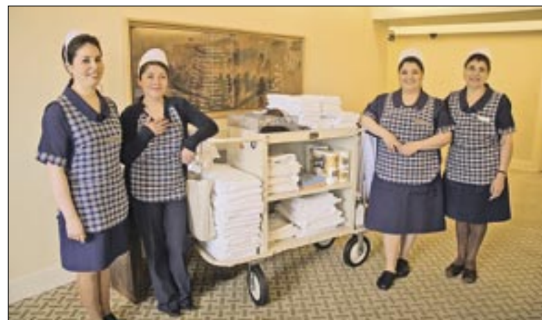
Mucamas del Hotel Cabo de Hornos.