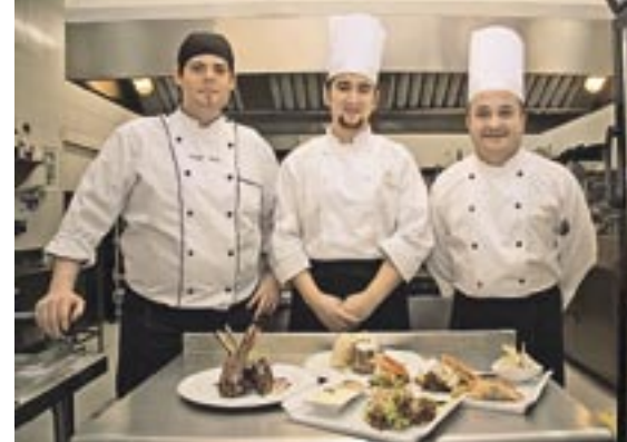
Personal del área gastronómica.