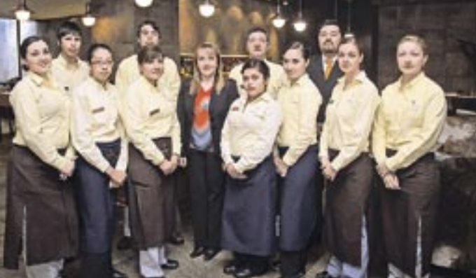
Personal del restaurant y bar.