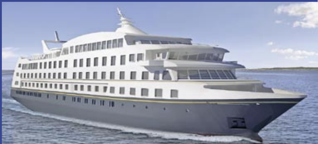
Imagen virtual del Stella Australis.

Para la temporada 2010-2011 estará en operación un nuevo crucero de expedición, celebrando así los 20 años de Cruceros Australis, compañía que navega por una de las regiones más vírgenes del planeta, la Patagonia y Tierra del Fuego chileno-argentina.